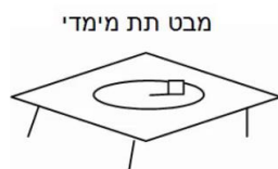
מבט תת מימדי